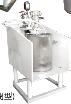
絕緣塗料台 PSiB (半封閉型)